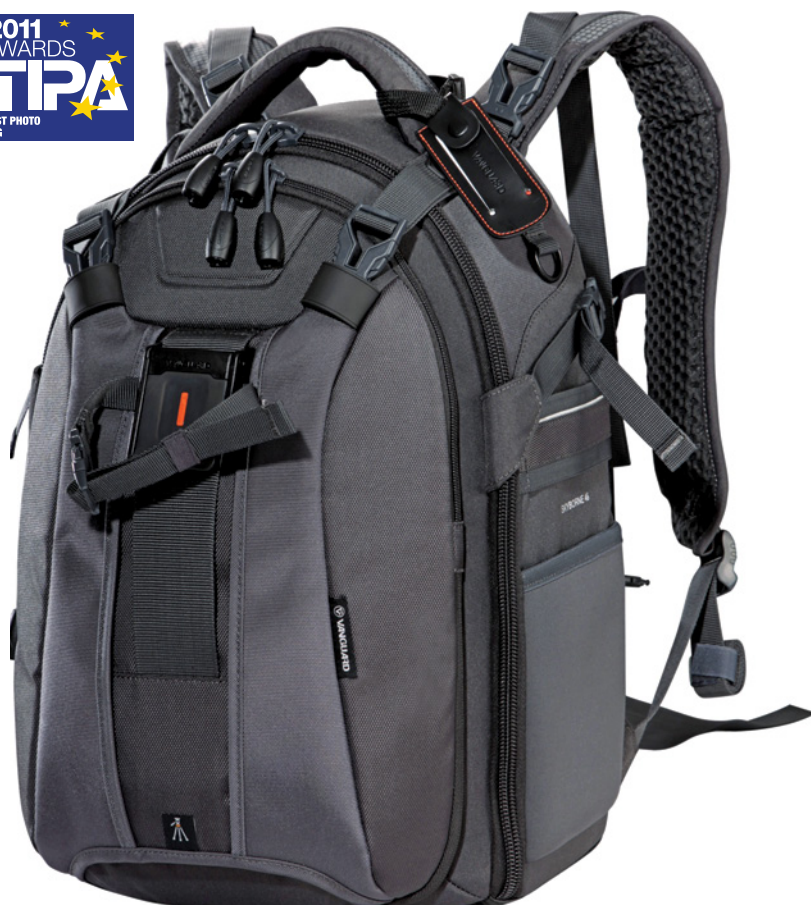
Le design du Skyborne lui a valu le prestigieux Prix TIPA 2011 pour Meilleur Produit Photo.