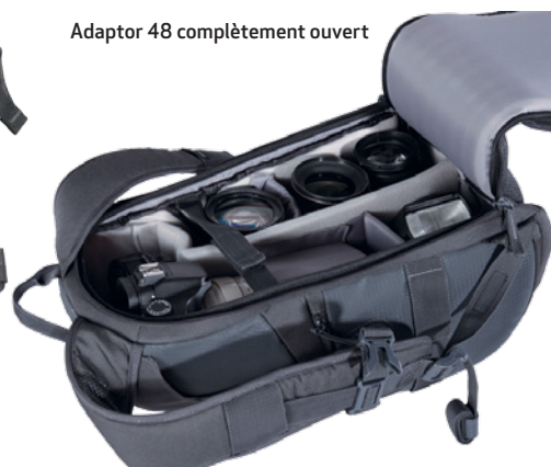
Adaptor 48 complètement ouvert