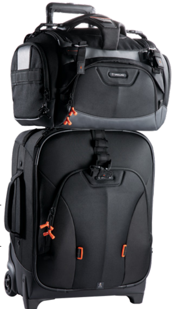
Sac Xcenior30 à roulettes

Le sac porté à l'épaule avec chargement par le haut demeure le plus populaire et existe en une myriade de différents modèles. Le terme «messenger», par exemple, a été généralisé afin de désigner les sacs à bandoulière de profil mince qui peuvent prendre de multiples couleurs et arborer différents logos selon leurs propriétaires qui sont légion à déambuler dans les rues. L'accès