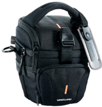
UP-Rise II 14Z