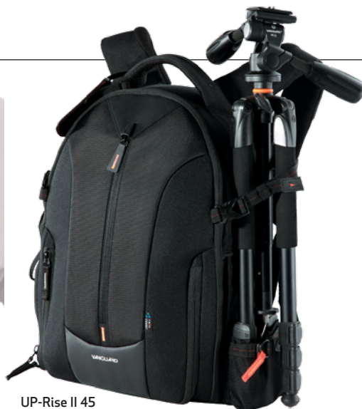
UP-Rise II 45

rapide et les séparateurs rembourrés amovibles sont à conseiller pour ces sacs et, si vous êtes du genre à trimbaler un portable, considérez une section rembourrée pour ce dernier.