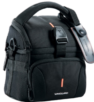
UP-Rise II 18

Un bon sac à dos possède une ouverture, voire plusieurs, permettant un accès facile de chaque côté et plusieurs poches avec fermeture éclair pour l'équipement. Idéalement il est imperméable et l'intérieur est personnalisable avec du rembourrage épais afin de bien y insérer vos accessoires. Si vous avez l'intention d'utiliser votre sac à dos pour autre chose, assurez-vous que ces compartiments rembourrés s'enlèvent.