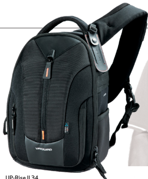
UP-Rise II 34