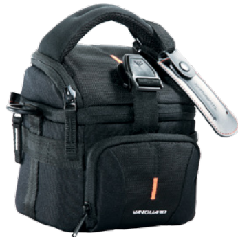
UP-Rise II 15