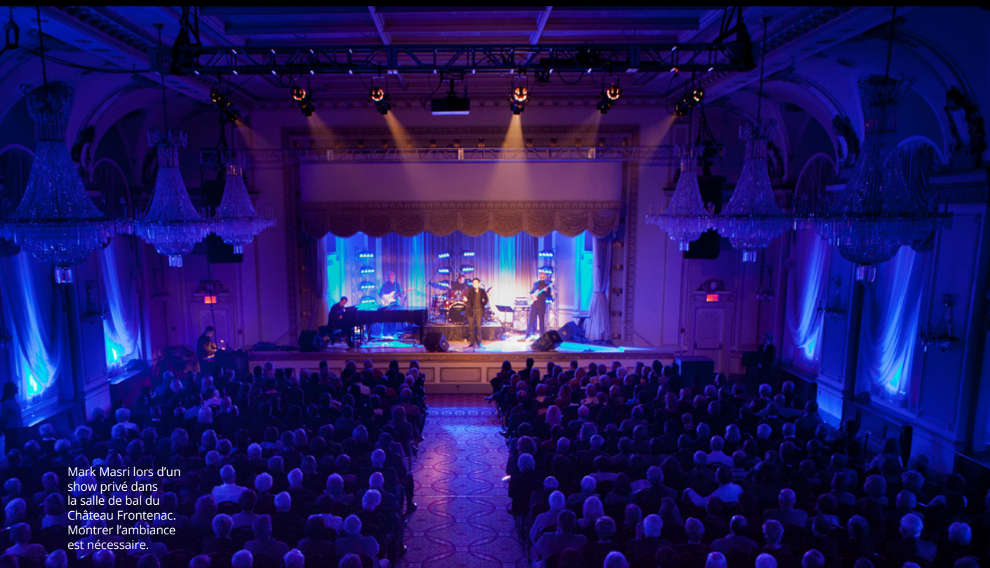
Mark Masri lors d'un show privé dans la salle de bal du Château Frontenac. Montrer l'ambiance est nécessaire.

Je fais de la photo depuis plus de vingt ans, et si quelqu'un me demande ce qui me procure la plus grande montée d'adrénaline en photographie, j'hésiterais entre le sport et les spectacles de musique. Permettez-moi de partager l'histoire de ma première expérience showbiz.