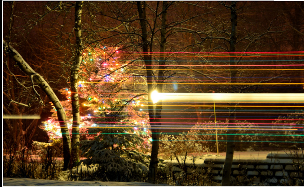
Mouvement de rotation sur trépied. Nikon D7100, obj. 50 mm, 10 s, f/5, 100 ISO

Dans les deux exemples ci-dessous, le même sapin de Noël est photographié. Sur la première image, la scène est bien exposée et le mouvement de rotation suit l'axe horizontal du trépied. La seconde image est sous-exposée et le déplacement de l'appareil a été fait à la verticale.