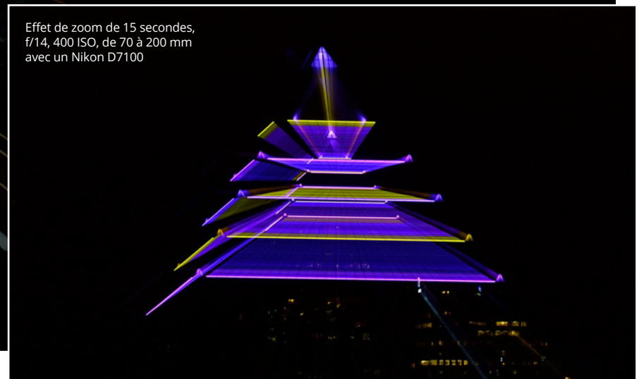
Effet de zoom de 15 secondes, f/14, 400 ISO, de 70 à 200 mm avec un Nikon D7100

Ces techniques sont amusantes et peuvent éveiller l'artiste en vous. Les millions de lumières du temps des Fêtes offrent des possibilités infinies. Donc, pendant cette période de réjouissances, n'attendez pas que le Père Noël fasse de la magie. Essayez les quelques trucs décrits ici et faites votre propre magie.