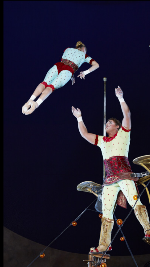
Pour saisir toute l'excitation de KURIOS™ – Cabinet des Curiosités, j'ai fait confiance au système de flash Broncolor Scoro – la technologie était vraiment importante en raison de la vitesse du flash – il peut atteindre 1/10000 de seconde, ce qui permet de geler le mouvement. Le Broncolor Para 177 m'a donné la lumière nette et puissante que je voulais pour ce type de photographie – il m'a permis d'utiliser la meilleure ouverture pour capturer le détail avec une bonne profondeur de champ. J'aime travailler à f/8 pour ce type d'assignation – le réglage de netteté optimale sur la majorité des objectifs.