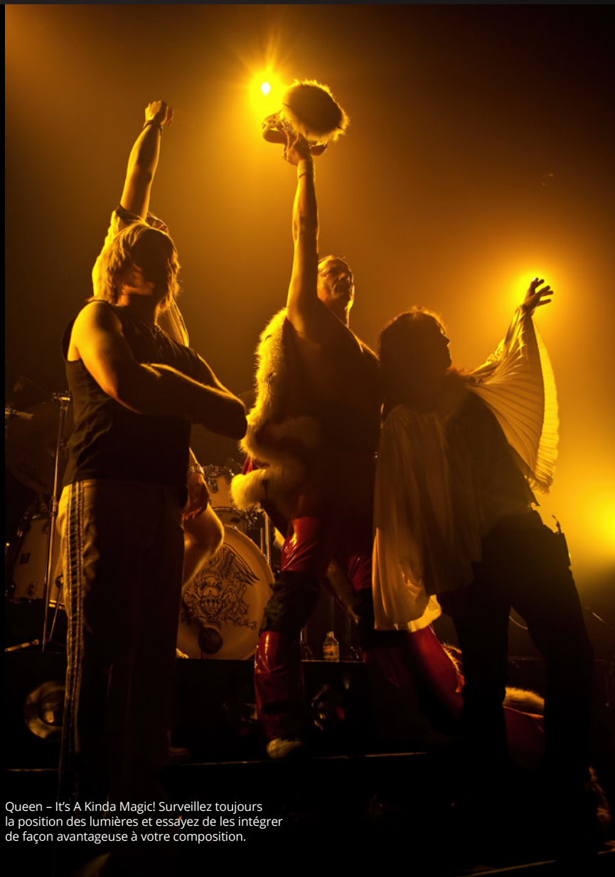
Queen – It's A Kinda Magic! Surveillez toujours la position des lumières et essayez de les intégrer de façon avantageuse à votre composition.

préfère faire les réglages de l'appareil et de l'objectif dans le but de créer des images qui reflèteront plus qu'un simple cadrage de l'action.