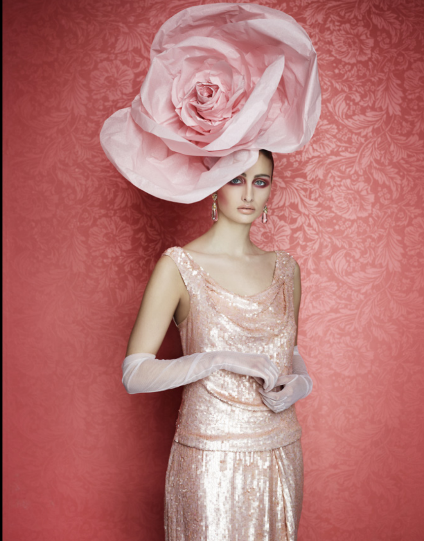
"Traviata" Opéra de Montréal