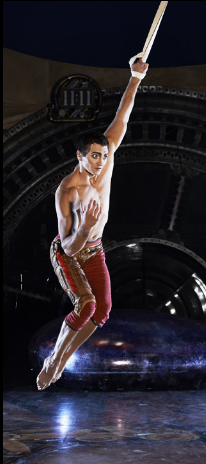
L'excitation de KURIOS™ – Cabinet des Curiosités – Cirque du Soleil, photographié avec un Contax 6/4x5 et dos numérique Phase One IQ-180. Broncolor Scoro / Para 177, 1/8000 s à f/8,5.

J'ai travaillé avec le Cirque du Soleil sur différents projets dans le passé. Les assignations sont toujours soumises à un calendrier serré où la planification et l'exécution précise du mouvement sont essentielles tant pour les athlètes que les photographes.